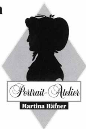
Foto-Arbeiten Filme Zubehör

Hauptstraße 65 · 63619 Bad Orb · Telefon: 0 60 52-71 71